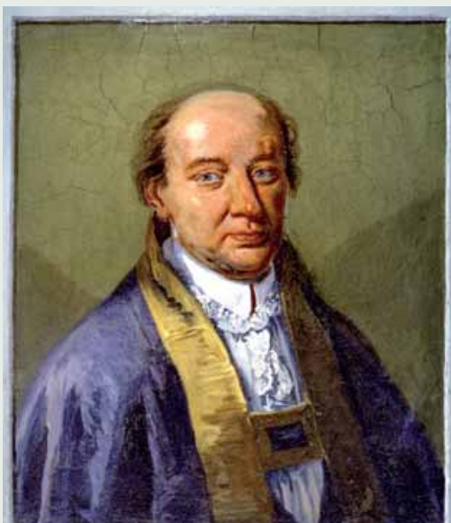
SIGEARDUS SEDEM TENUIT AQUILEIEN, DUM GREGORIUS. VII. TENERET ROMANAM, CUIUS NO. MINE TRIBURIENSI CONCILIO PRO DEPOSITIONE HEN

Il patriarce Siar cemût che al è rapresentât tal Palaç Arcivescovil di Udin.