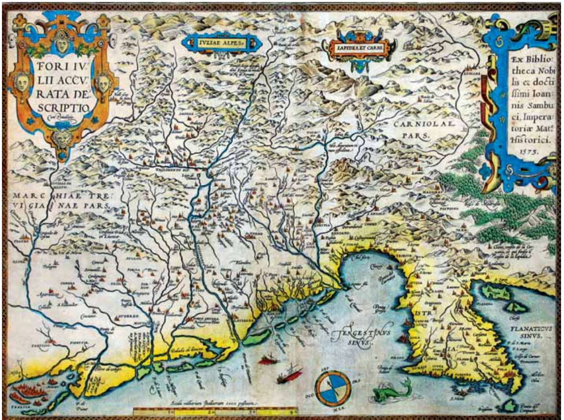
Fori Iulii accurata descriptio, A. Ortelio, 1573, Biblioteca civica di Udine.

Furlan, une lenghe che ti Friulano, una lingua che ti arricchisce!