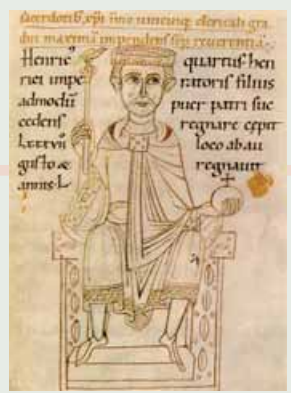
Indri IV Enrico IV

Il patriarca Sigerado com'è raffigurato nel Palazzo Arcivescovile di Udine.